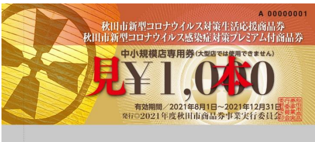
中小規模店専用券

△ A券にもB券にも「中小規模店専用券」と「共通券」がありますが、オレンジ色(左下)の「中小規模店専用券」、みどり色(右下)の「共通券」の分類は不要です。